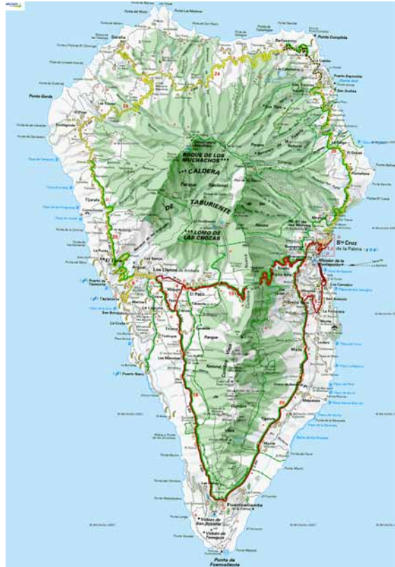
La Palma < http://mappery.com/map-of/La-Palma-Physical-Map >. Luettu 29.3.2011.