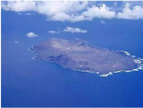
Alegranza < http://www.lanzarote.org/blog/?p=629 >. Luettu 31.3.2011.