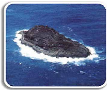
Roque del Oeste < http://www.reptilesdecanariastjorge.com >. Luettu 31.3.2011.